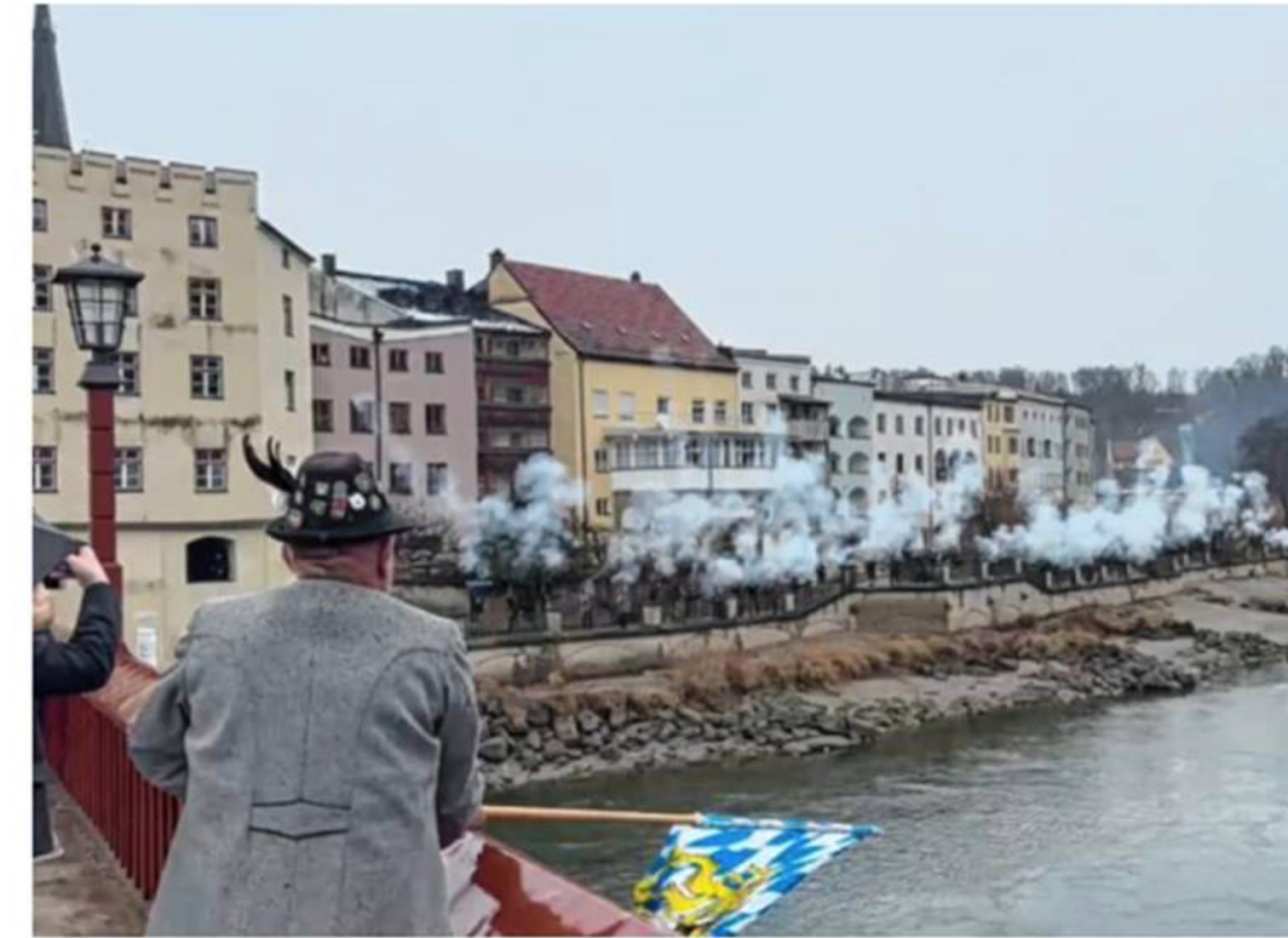
Vier Salven von 60 Böllerschützen gab es zum Auftakt der Feierlichkeiten zum Gründungsjubiläum. FOTO

Mit einem humorvollen Seitenhieb auf die Politik ließ schließlich Helmut