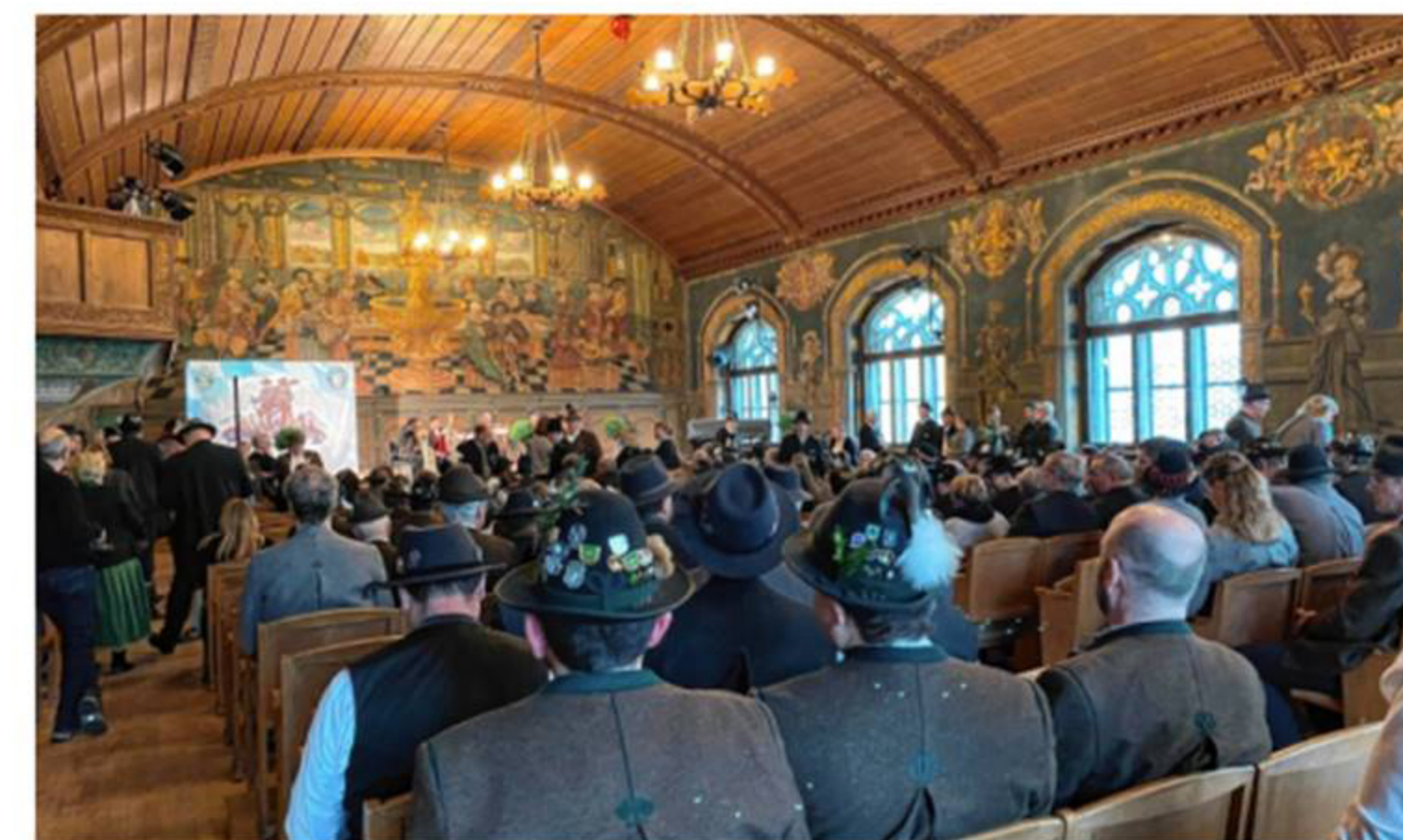
Voll besetzt war der Rathaussaal beim Gauschützen-Jubiläum. FOTO

Schwarzenböck die Geschichte des Gaus Revue passieren. Die nächsten 100 Jahre gehe es den Schützen gut, wenn die Politiker all das einlösten, was sie versprechen würden, sagte er. Dann schilderte er das Schützenwesen, das in Wasserburg bereits 1543 seinen Anfang nahm, bis in die Gegenwart.