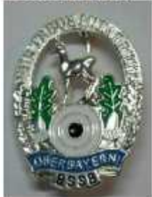
Silberne Gams Bezirk (410)