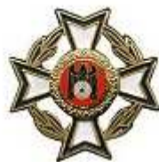
Ehrennadel des Präsidenten Bronze - ab 15 Jahre