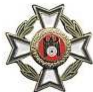
Ehrennadel des Präsidenten Grün - ab 10 Jahre

Der Deutsche Schützenbund verleiht an Schützinnen und Schützen, die seit vielen Jahren für ihren Verein im Sportschießen aktiv tätig sind, die Ehrennadel des Präsidenten.