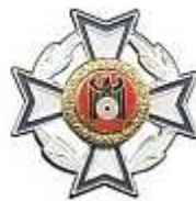
Ehrennadel des Präsidenten Silber - ab 20 Jahre