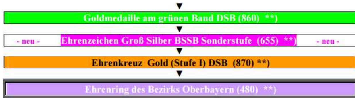
Ehrenring Bezirk (480)