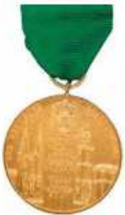
Ehrenkreuz Gold DSB (870)