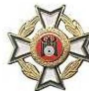
Ehrennadel des Präsidenten Gold - ab 25 Jahre